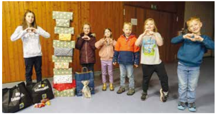
Ein Teil der Kinzigspatzen mit den gepackten Päckchen.

Den Abschluss des Jahres bildete wie jährlich die „besinnliche Adventsstunde“ in Neudorf, bei dem