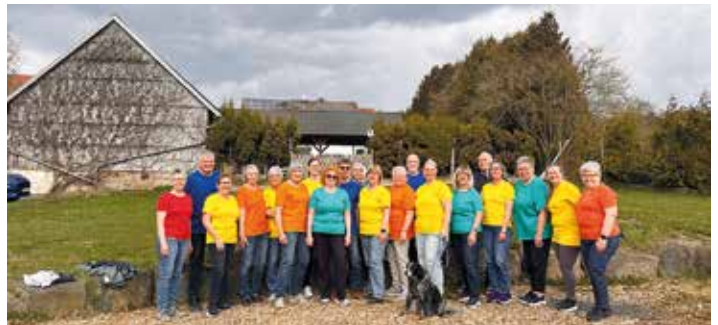
Kleine Pause für das Foto der Gloria-Singers beim Probewochenende.