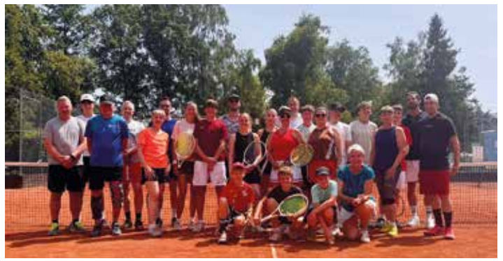
Alle Teilnehmer des Schleifchen-Turniers auf einen Blick.

fahrern. Mit großem Engagement betreuten sie die Nachwuchsfahrerinnen und -fahrer und vermittelten erste Grundlagen im Umgang mit dem Motorrad. Auf verschiedenen Fahrzeugen (vom elektrischen STACYC-Bike für die Kleinsten bis hin zu Motorrädern mit 85 ccm) konnten die Kinder unter fachkundiger Anleitung ihr Fahrgefühl und ihre Geschicklichkeit testen. Auch ein Jugendquadrant stand zur Verfügung. (Ganzer Artikel: www.vgv-waechtersbach.de )