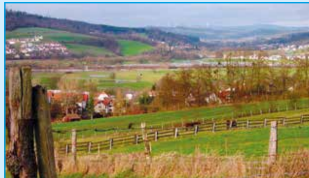
Blick auf Aufenau, Innenstadt, Hesseldorf, Weilers und Neudorf

Die Beschilderung leitet am Ende von Aufenau wieder ins Tal, wo nach dem Überqueren der Landstraße ein Rad- und Fußweg zum Wächtersbacher Bahnhof führt (ca. sieben weitere Kilometer).