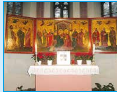
Kath. Kirche Aufenau mit Triptychon, Mitte 15. Jh.