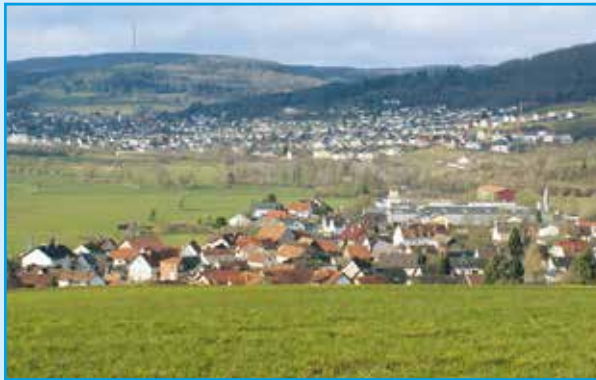
Das Brachtal mit Neudorf und Kinzigtal mit Innenstadt.

Von hier wandert der Blick ins Brachtal mit Hesseldorf, Weilers und Neudorf, zum Kinzigtal mit Aufenau und Kinzighausen sowie zur gegenüberliegenden Innenstadt.